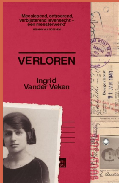
Verloren door Ingrid Vander Veken (2023) Verschenen bij Uitgeverij Vrijdag

Ingrid: Ik heb die getuigenis, samen met wat ik terugvond in oude politiedossiers en processtukken, eraan toegevoegd als ontknoping. Met alle getuigenissen en puzzelstukken, die allemaal met elkaar te maken hebben, moest ik van in het begin een spannend verhaal zien te maken. Dat is dan het metier van de schrijver. Als mensen dan achteraf zeggen: "Ik lees eigenlijk alleen maar thrillers, maar dit boek heb ik gelezen alsof het een thriller was, want het is zó spannend," dan denk ik: 'Yes!'